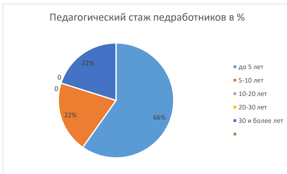
Рисунок 4. Педагогический стаж педработников(в %)

По итогам 2022 года ДОО перешел на применение профессиональных стандартов. Из 9 педагогических работников детского сада все соответствуют квалификационным требованиям профстандарта «Педагог». Их должностные инструкции соответствуют трудовым функциям, установленным профстандартом «Педагог».