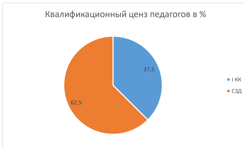
Таблица 9. Образовательный ценз педагогов (в %)